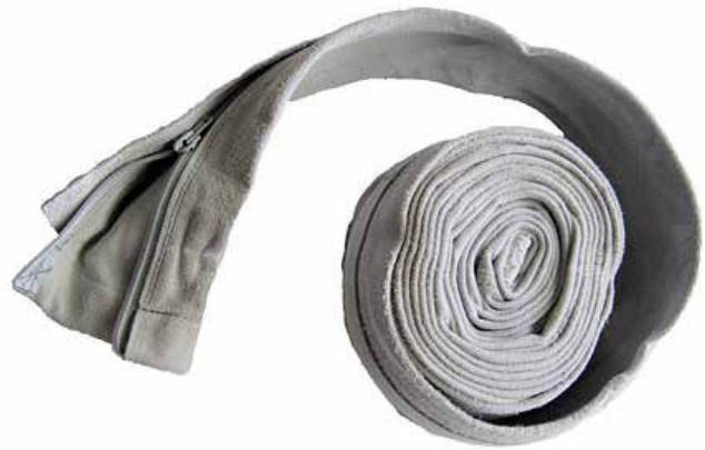
Produktbeispiele / product examples